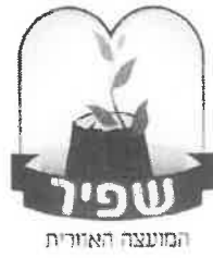
הצעת תקציב 2020 השוואת הוצאות 2019 לשנת תקציב 2020